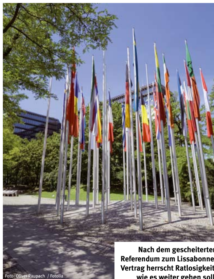
Nach dem gescheiterten Referendum zum Lissabonner Vertrag herrscht Ratlosigkeit, wie es weiter gehen soll.

Der EU-Reformvertrag (auch „Vertrag von Lissabon“ genannt) ist derzeit – insbesondere wegen der Ablehnung der IrInnen – in aller Munde. Was besagt dieser Vertrag eigentlich und welche Neuerungen beinhaltet er? Der ÖGB hat große Erwartungen in die Reform der EU gesetzt, die die Zusammenarbeit in der gewachsenen Union der 27 Mitgliedstaaten vereinfachen soll.