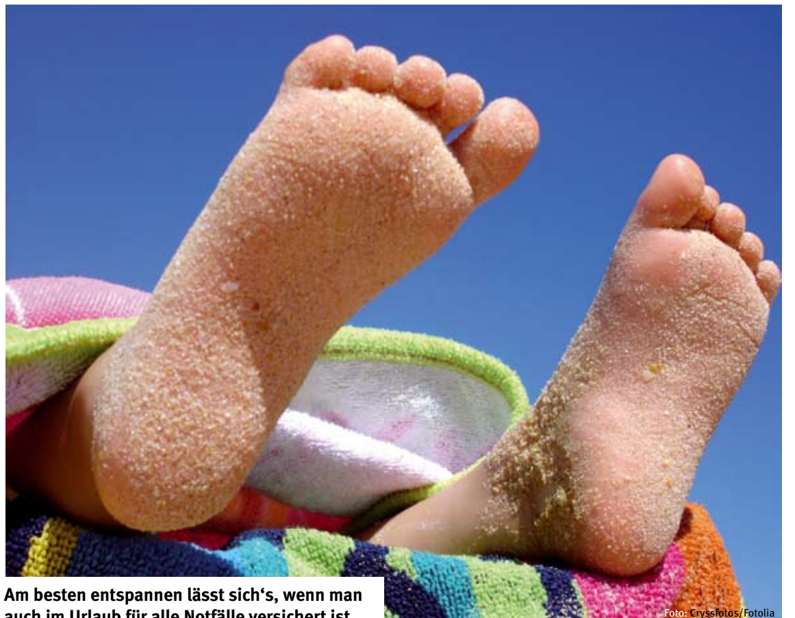
Am besten entspannen lässt sich's, wenn man auch im Urlaub für alle Notfälle versichert ist.

Der Versicherungsschutz im Ausland: Die Versicherungsanstalt für Eisenbahnen und Bergbau hat alle Infos für Sie zusammengefasst.