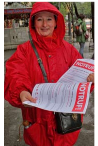
Mit einem Flugblatt wurden AutofahrerInnen und PassantInnen informiert.

Kontakt: 01/54641-410 oder rudolf.wagner@vida.at