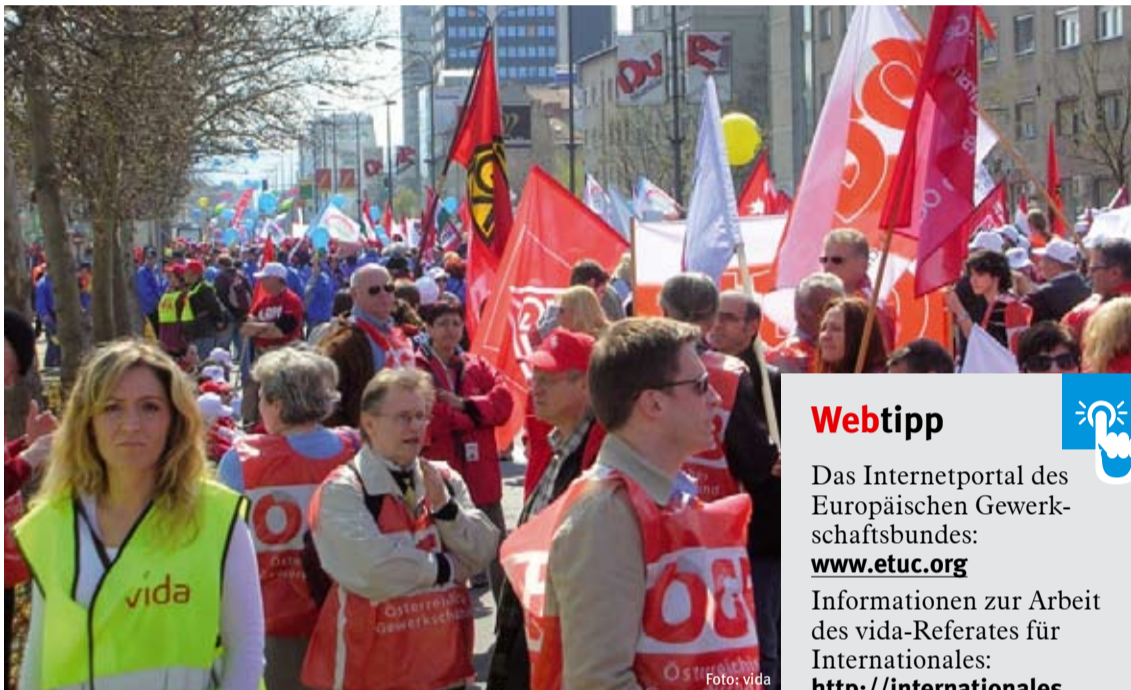
Europa muss zur Sozialunion werden! Mehr als 35.000 Menschen gingen dafür im April bei der EGB-Demo in Ljubljana auf die Straße.

Im Dezember 2007 und April 2008 fällt der Europäische Gerichtshof (EuGH) drei Urteile mit schweren Auswirkungen auf Gewerkschaften und die Rechte der ArbeitnehmerInnen.