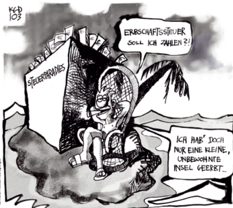
Karikatur: Kostas Koufopoulos

Rasch regulieren. „Hedgefonds verbieten statt Glühbirnen verbieten!“ Mit diesem Motto machte ein Leserbriefschreiber seinem Ärger über das Fehlen jeglicher Kontrolle für die Hedgefonds Luft. Der Sager mag übertrieben sein, klar ist aber: Wir brauchen eine strenge Regulierung der Hedgefonds. Nicht am St. Nimmerleinstag, sondern jetzt. (mf)