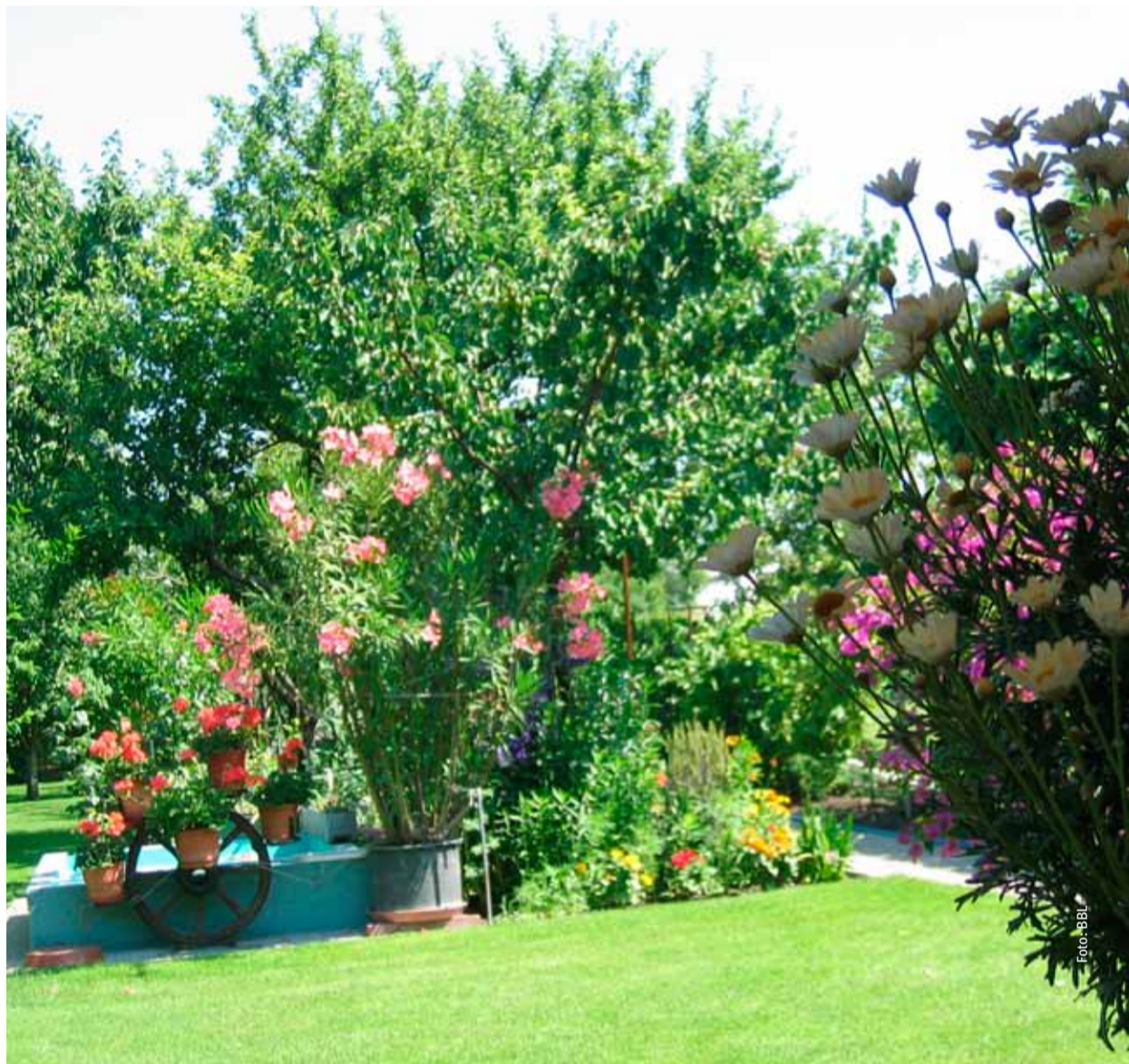
Kleingarten: mehr als nur eine Sozialleistung der ÖBB, sondern Ruheoase für viele BBL-Mitglieder.

Schon 97 Kleingartenanlagen mit langfristigen Verträgen stellt die ÖBB-Landwirtschaft zur Verfügung. Das bringt mehr Rechtssicherheit für ihre Mitglieder.