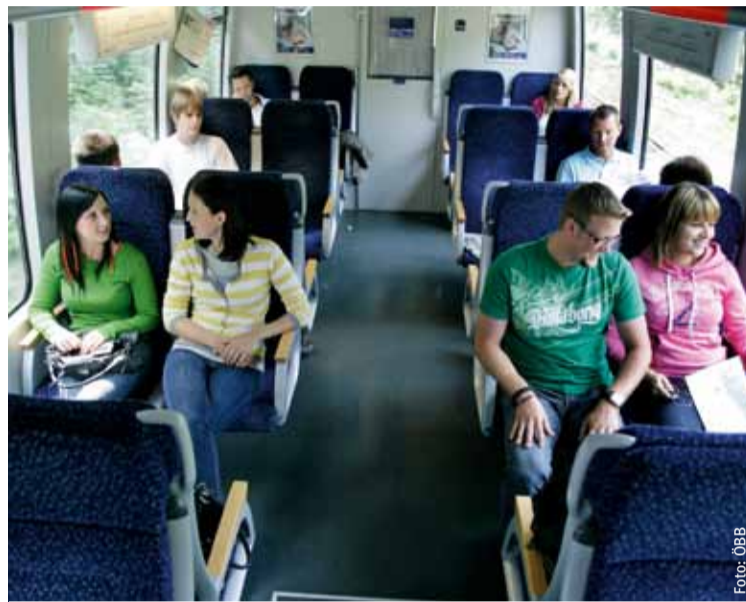
Die Kampagne „Unsere Bahn muss rot-weiß-rot bleiben“ verdeutlicht, dass die Bahn täglich für 1, 2 Mio. Menschen da ist.

Chaosreform. Mehr Manager als je zuvor, Bonuszahlungen ohne Ende und Spekulationsverluste in Millionenhöhe – so liest sich die Schreckensbilanz der so genannten ÖBB-Strukturreform aus dem Jahr 2003. Diese trotz aller Warnungen seinerzeit von ÖVP, FPÖ und BZÖ durchgepeitschte Zerschlagung des Unternehmens