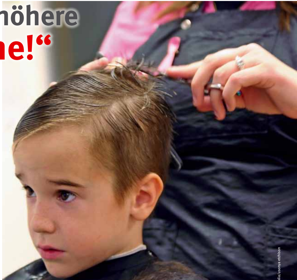
1.000 Euro Mindestlohn ist bei den FriseurInnen Realität. Für die KosmetikerInnen gibt es dagegen nach wie vor keinen Mindestlohn.

Neuer Meilenstein. Klar ist für die Gewerkschaft, dass es auch